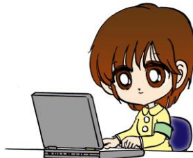
コンシェちゃん (キャラクターデザイン 高橋郁丸)