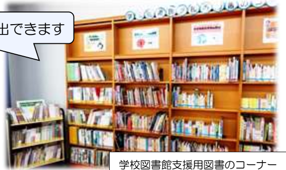
学校図書館支援用図書のコナー