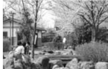
水量の増加や安全面での 地域の都市化が進み、排 水の増加や安全面での 土の水路でしたが、周辺 す。初めは地表を流れる を排出する重要な水路で る。

じょんのび館～障害者割引を実施 対象 身体障害者手帳、障害者保健福祉手帳、 または療育手帳を持っている人と介助者 入館料 中学生以上…500円(割引前850円)、 4歳以上小学生まで…350円(割引前500円)、 介助者…無料 問い合わせ 同館(☎0256-72-4126)へ