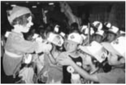
人形劇の公演後、人形と握手をする子どもたち

罫◇は当日直接同館へ、◆は同館(☎279-2113)へ ※月曜休館 ◇ミニシアター 回 5月17日(水) 午後2時45分～3時15分、27日(土) 午前11時～同30分 囚 絵本の読み聞かせ、パネルシアター、ほか 囚幼児以上(幼児は保護者同伴) ◆すくすく工作～U3age 回 5月30日(火) 午前10時半～11時半 囚 親子で遊びながら簡単工作 罫100円