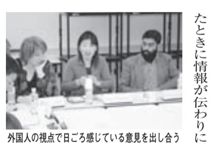
外国人の視点で日ごろ感じている意見を出し合う

さまざまな国籍や文化を持つ人たちにとって住みよいまちにしよと、「外国籍市民懇談会」の初会合を11月30日に開催しました。 この懇談会は、本市で暮らす外国人から普段の暮らしで困っていることなどを聞き、誰もが快適に暮らせるにはどうしたら良いかを考えていくもので、ことし初めて設置しました。 委員は、中国、韓国、モンゴル、パキスタン、フランスなどさまざまな国籍の人や、外国人の生活を支援している団体の