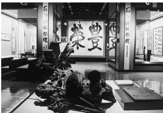
作品とコレクションで触れる松蔭の世界 (豊栄博物館展示室)