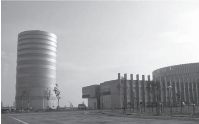
基幹浄水場として完成した信濃川浄水場

祖父興野地内(新潟地区)に平成12年から建設を進めてきた「信濃川浄水場」がこのたび完成し、10月1日から運転を開始します。敷地面積は8万9000平方メートル、施設能力は1日8万立方メートルで、今後、市の基幹浄水場としての役割を担います。