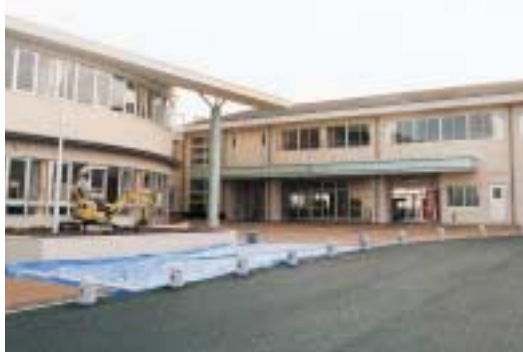
完成間近な黒埼南小学校

敷地面積は2万2000平方メートルで、校舎の延べ床面積は3861平方メートル。高層建築物がない周辺環境と調和する、この配屋根の2階建て校舎です。普通教室9室、音楽室などの特別教室のほか、ポケットパークを設け、地域の皆さんも気軽に利用できる。授業や学校開放にも利用できるランニングコースを設けています。グラウンドには100メートルの直線コースと、200メートルトラックを整備したほか、ポケットパークを設け、地域の皆さんも気軽に利用できる。