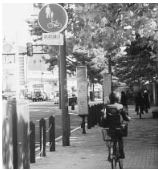
歩行者の安全に配慮した運転を

自転車は道路交通法上では車両の一種として区分され、原則的に車道の左端を通行することになっていません。 標識がある歩道に写真では自転車も通行することができ、歩道は歩行者優先です。歩道は歩行者を妨げるときは、一時停止するか、自転車を降りて押して歩くなど、十分注意して安全な走行を心がけましょう。 また、自転車の2人乗りや傘さし運転、携帯電話を使いながらの運転など、十分注意して安全な走行を心がけましょう。