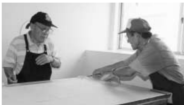
福祉施設での障子の張り替え作業

「市政改革・創造推進」に基づく財政健全化の一環として、未利用の市有地を一般競争入札により売却します。 一般競争入札による市有地の売却は、昭和43年に旧新潟競馬場跡地（関屋）の売却で実施して以来、35年ぶりとなります。今回対象となるのは、関新3丁目5区画です。 入札申し込み期間 10月14日～24日午前9時～午後5時（土・日曜を除く） 受付場所・問い合わせ 管財課（市役所本館5階 内線2202）へ 入札手続きの案内書は、