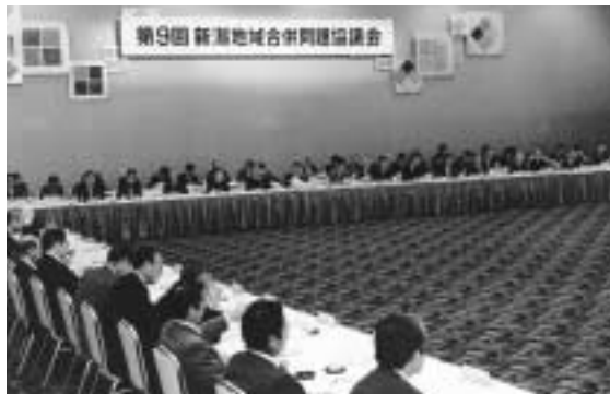
最後の任意協となった9回目の会合

本市と近隣12市町村が広域合併について話し合う「新潟地域合併問題協議会」の9回目の会合が9月29日に開かれ、この回をもって任意の合併協議会(以下任意協)の協議が終了しました。今後の合併協議は、各市町村議会の議決を経て設置される法定合併協議会(以下法定協)に移行することになり、日本海側の政令指定都市実現に向けて大きく前進しました。