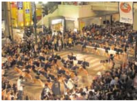
昨年の「にいがた総おどり」祭

9月13日から15日、「にいがた総おどり」祭が開催されます。昨年同様、2回目を迎えます。この催しは、新しい踊りを通じて、活力とにぎわいをつくり、市民生活の活性化を図ることを目的としており、市では今年から支援を行います。