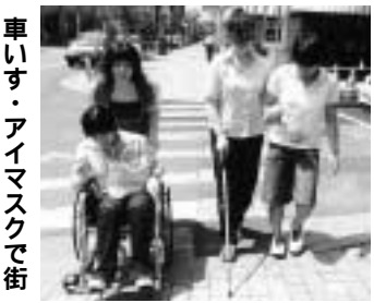
車いす・アイマスクで街を点検

ボランティア活動を実際に体験することで、福祉についての関心と理解を深め、普段の生活の中に生かしてもらおうと、市ボランティアセンターでは7月31日から「夏休みボランティア体験学習」を開催しました。