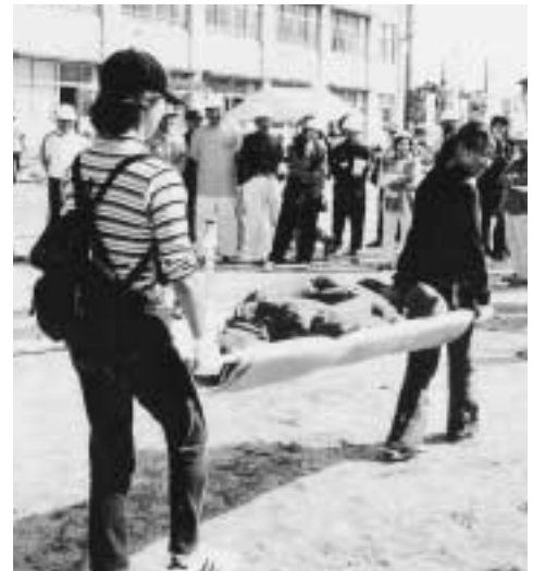
毛布と物干しざおで応急担架を作成(坂井輪小学校区自主防災会防災訓練)

自主防災組織が実施する防災訓練にかかった経費の一部を助成しています=表1・2=。詳しくはお問い合わせください。