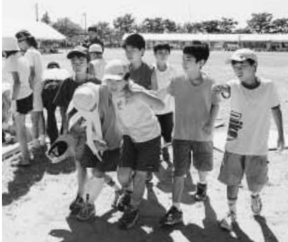
昨年の防災訓練(立仏小グラウンド)

昭和39年6月16日の新潟地震の教訓を風化させることのないよう、毎年防災訓練を実施しています。ことしの防災訓練は、市内で震度6強の地震が発生したとの想定のもとで、南地区の紫竹山小学校で開催します。 不意の大地震が起こったとき、皆さんは冷静に行動できますか。いざ災害が起こったとき、日ごろの備えが大変役に立ちます。防災訓練に参加して、いろいろな体験をしてみてください。 日時 きょう15日午前9時45分～正午 会場 紫竹山小学校グラウンド 荒天時には体育館で実施 内容 救出救護訓練、初期消火訓練、応急手当訓練、はしご車試乗体験、起震車体験、濃煙体験、展示コーナー、ほか