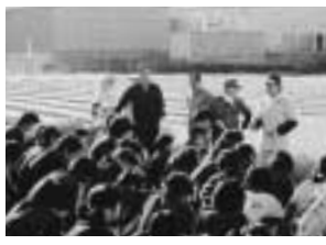
鳥屋野中教育田で生徒と稲刈り

栽培しています。減反政策や輸入の拡大など、農業を取り巻く環境は厳しくなっています。