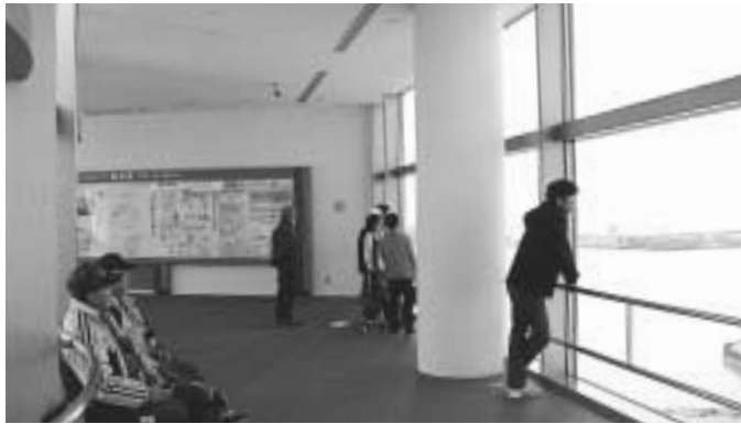
港や市内を一望できる展望展示室

山の下みなとタワー展望展示室で、昨年10月に「海王丸」のフォトコンテスト入賞作品を展示します。 展示するのは、入賞作品19点のほか、海王丸の概要を紹介するパネルなどです。 海王丸は、平成元年に建造された、世界最大級の帆船。その年に最も速く走った帆船に贈られる「ホストン・ティーパー」ト・トロフィーを、これまで4度受賞しています。 展示室は、入賞作品19点のほか、海王丸の概要を紹介するパネルなどです。 海王丸は、平成元年に建造された、世界最大級の帆船。その年に最も速く走った帆船に贈られる「ホストン・ティーパー」ト・トロフィーを、これまで4度受賞しています。