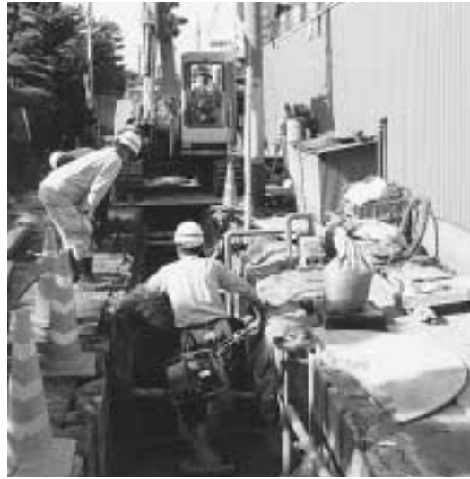
下水道処理区域の拡大に向け整備進む

平成15年度から5年間の下水道整備の基本方針となる、下水道整備新5カ年計画「にいがた下水道プラン」の策定を進めています。このほど、その計画案がまとまり、計画案の概要を幅広く市民の皆さんに公開し、意見を計画に反映させる取り組みとして、PI（パブリック・インボルブメント）を実施します。 PIとは、住民参加の施し、機能を効果的に発揮するための、地域住民など関係者の協力が不可欠であり、また、その意思を施策に反映させることが必要となります。その方法として、下水道整備の新たな5カ年計画