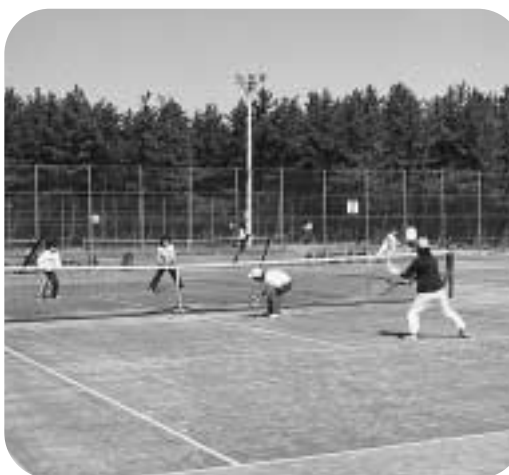
西総合スポーツセンターテニスコート

屋外スポーツ施設の利用受け付けを始めます。 問い合わせ・申し込みは表中の備考欄の受付先へどうぞ。受付先のないものは、(財)市開発公社(市陸上競技場内、月曜~土曜午前8時半~午後5時15分、☎266-8111)へ