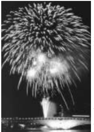
新潟まつり花火大会の打ち上げ場所が変更されたことにより、打ち上げ場所が信濃川上流のりゅーとぴあ付近に移動する。打ち上げ時刻は、これまでと同様に午後8時30分から開始する。

夏の風物詩、新潟まつり花火大会の打ち上げ場所が、ことしから変更になります。 新しい打ち上げ場所は、信濃川左岸のりゅーとぴあ近く。これまでより約700メートル上流となり、昼・夜の花火が同じ場所で打ち上げられることとなります。 打ち上げ場所の見直しは、現在の打ち上げ場所の危険区域内でマンションなどの開発が進み、区内住民全員の退去同意や車両の移動先などを得ることができず、見物場所にも大きな変更がないことなどから、りゅーとぴあ近くを新しい打ち上げ場所として決定しました。 同実行委員会では、まつりのより一層の盛り上がりを目指して、協賛金の募集方法や民謡流し、まつり行列