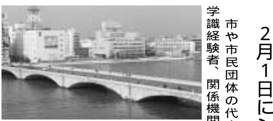
本市のシンボル万代橋

◆青少年三川自然の森キャンプ場(東蒲原郡三川村大字谷花) 開設期間 5月1日～10月31日 施設・設備 温水シャワー有り、キャンプ場、キャンプファイヤールーム、炊事場、アスレチック遊