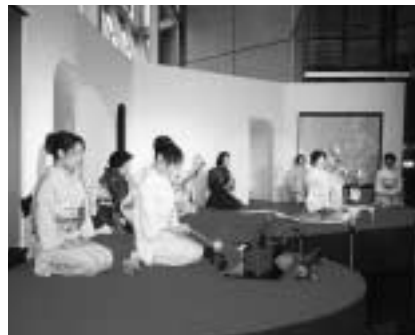
昨年の市民伝統文化祭

日時 2月7日～9日 午前10時～午後6時 ◆茶席(2席) 内容 茶席(2席)、生け花展、邦楽演奏、新潟漆器・陶芸作品