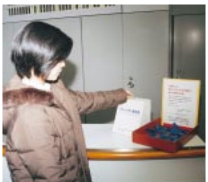
市役所本館案内に設置した募金箱

市役所では12月16日から、ブルーリボンの着用と支援募金の協力を職員に呼び掛けて、拉致被害者の支援に協力しています。