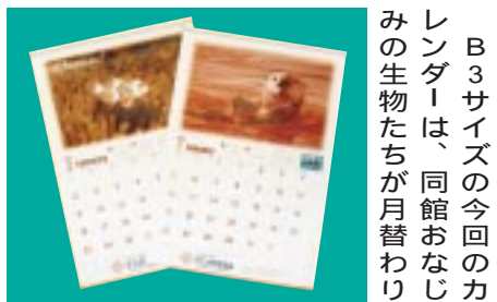
B3サイズの今回のカレンダーは、同館おなじみの生物たちが月替わり

市役所では12月16日から、ブルーリボンの着用と支援募金の協力を職員に呼び掛けて、拉致被害者の支援に協力しています。