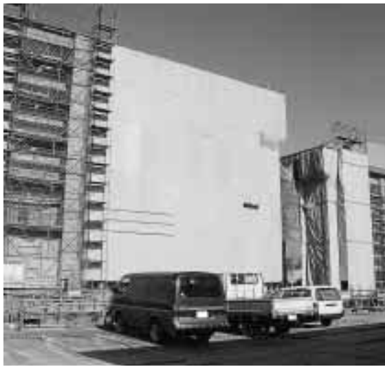
市立明鏡高校の隣接地で建設が進む市立万代高校

市立明鏡高校の隣接地で建設が進む「市立万代高校」が4月に開校します。新しい時代を切り開き、未来に羽ばたく人材を育成しようとする。普通科（総合選択制）と英語理数科を設置。国公立大学などへの進学に向けた科目構成と、幅広い選択システムを用意しています。