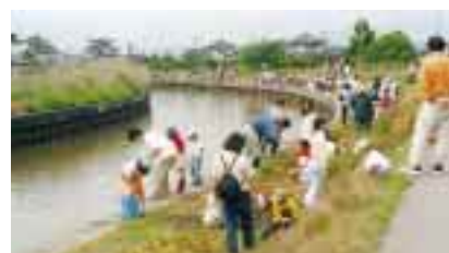
地域部門・最優秀賞 坂井輪中学校区青少年育成協議会

地域部門 最優秀賞 坂井輪中学校区青少年育成協議会 奨励賞 2・3・2・7 問い合わせ 市都市緑化推進協会