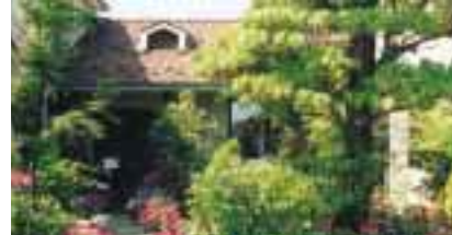
事業所部門・最優秀賞 ワインと四季の食彩 味蔵