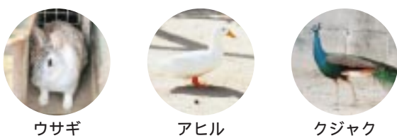
ウサギ アヒル クジャク