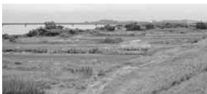
泰平橋から望む阿賀野川右岸河川敷

阿賀野川右岸の河川敷(新崎、濁川地先)に、広大な緑地整備を計画しています。緑地内には、身近な自然に触れることができる自然生態観察園や、散策やスポーツなどを楽しめる広場などを設ける予定です。今年度は実施設計を行います。 整備するのは、泰平橋から下流に向かって1.6kmの阿賀野川右岸河川敷約20m。雄大な阿賀野川と調和した景観を演出し、良好な河川環境の保全に配慮した「親水空間」を創出します。