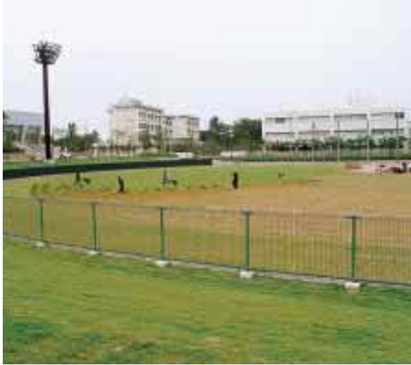
外野スタンドから見た西海岸公園少年野球広場

昨年6月から改修工事を進めてきた「少年野球広場」の整備が完了し、7月1日にオープンを迎えます。ナイター設備を設け外野に芝を張るなど、野球場としての機能を充実しました。6月29日には、こけら落としとして小学生の野球チームによる試合を予定しています。