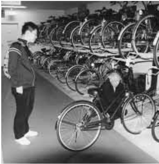
買い物や観光などさまざまな利用が期待されるレンタサイクル

古町6番町と万代シティの商店街振興会などで構成するレンタサイクル研究会では、新潟中心地区レンタサイクル社会実験を実施しています。 中心商店街の活性化などを目的としたこのレンタサイクルは、自転車を活用することで、万代シティと新潟駅周辺、古町の各商店街の行き来を便利にするのが狙い。そのため、古町で自転車を借りて、万代シティでその自転車を返却するというように、貸出場所と返却場所が違ってよい仕組みが、貸出時間と返却時間 10月27日まで 午前10時～午後