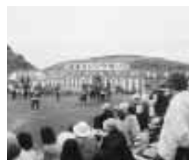
佐渡カンゾウまつり

古町6番町と万代シティの商店街振興会などで構成するレンタサイクル研究会では、新潟中心地区レンタサイクル社会実験を実施しています。 中心商店街の活性化などを目的としたこのレンタサイクルは、自転車を活用することで、万代シティと新潟駅周辺、古町の各商店街の行き来を便利にするのが狙い。そのため、古町で自転車を借りて、万代シティでその自転車を返却するというように、貸出場所と返却場所が違ってよい仕組みが、貸出時間と返却時間 10月27日まで 午前10時～午後