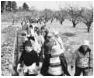
昨年の梅の道散策スタンプラリー

県内一の梅の生産量を誇る亀田町で、3月31日に「梅の道散策スタンプラリー」が開催されます。