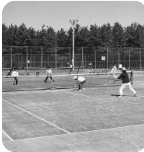
西総合スポーツセンターテニスコート

屋外スポーツ施設の利用受け付けを始めます。 問い合わせ・申し込みは表中の備考欄の受付先へどうぞ。受付先のないものは、市開発公社(市陸上競技場内、月～土曜午前8時半～午後5時15分、266-8111)へ