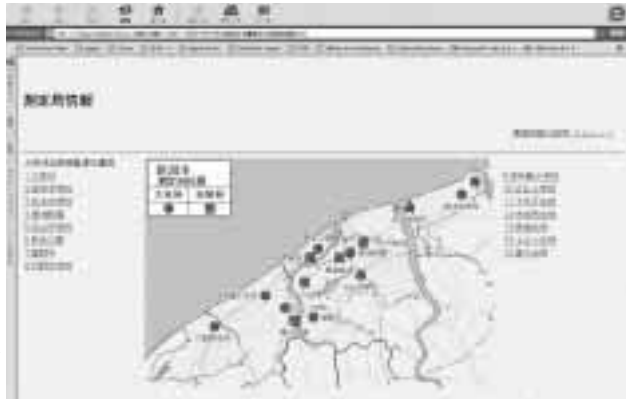
ホームページの掲載内容

する一般大気環境測定局が11局、道路周辺に配置する自動車排出ガス測定局が5局、計16の測定局がありま