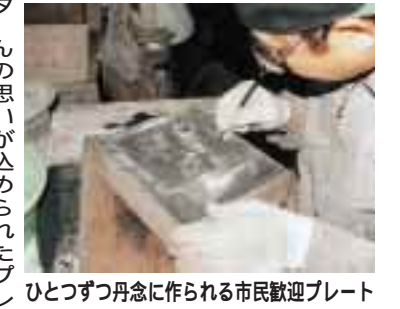
ひとつずつ丹念に作られる市民歓迎プレート

設 交通手段など、新潟のまちのさまざまな情報を収集する「ウェルカム探偵団」。同会のホームページから、情報を入力できるようになりました。新潟を訪れる人に紹介したい、お助めの情報があります。ぜひお知らせください。 集まった情報は、データベース化し、街角に立つ案内ボランティアの資料や情報マップなどに活用されます。 アドレス http://www.welcomeniigata.jp ビッグスワンへの観客客を歓迎するため、市道弁天線の歩道に設置する「市民歓迎プレート」の製作が、現在急ピッチで進んでいます。