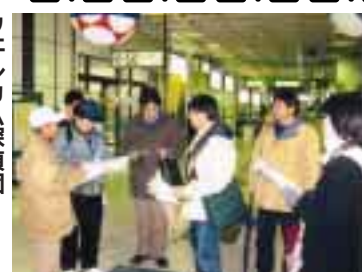
ウェルカム探偵団

市民の皆さんから募集した同プレートは、縦横15センチのアルミ製プレートで、自筆の氏名などが表面に刻まれます。5月中旬に、皆さん