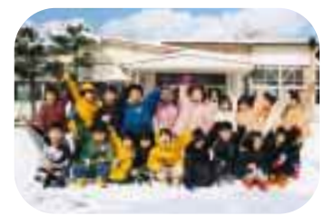
興野保育園(金巻) きりん組の皆さん

今年20歳になります。新潟でこんなビッグな大会が行われる記念すべき年に、成人式を迎えるんです。そのすこすこうれしいです。大会、見に行きたいなあ。チケットが取れなくても、大画面で見たい。ひとりひとりに「サッカー楽しんでみてね、すこい大会だよ」と声をかけて、みんなで盛り上げていきたいです。