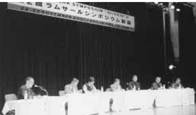
国内外のさまざまな事例報告などが行われたラムサールシンポジウム

渡り鳥の保護や湿地保全などについて考える「ラムサールシンポジウム新潟」が、11月22日から24日まで本市で開催されました。