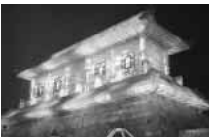
ハルビン市の冬の風物詩「氷祭り」