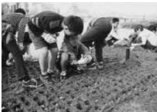
やすらぎ堤右岸で球根を植える南万代小の児童

10月15日から25日にかけて、白新中、南万代小、白山小、鏡淵小の生徒・児童が、やすらぎ堤に約2万6000球のチューリップの球根を植えました。これは、やすらぎ堤を市の花・チューリップで飾り、訪れる人たちに楽しんでもらおうと、市が平成6年から実施している。今年はやすらぎ堤全体で約7万1000球を植えます。