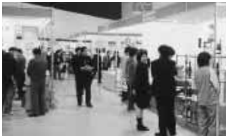
昨年のビジネスメッセ

11月9・10日に、市産業振興センターで「新潟ビジネスメッセ2001」を開催します。会場では、IT（情報通信技術）ビジネスのほか、ニューアイテム、ニューサービス、ニューテクノロジー、フランチャイズ、代理店募集などのビジネスゾーンを設けて、出展企業が最新の技術や商品などを紹介します。特に今年は、ITビジネスゾーンを大幅に拡大。昨年の2倍もの企業が出展します。