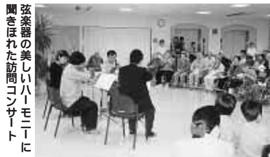
弦楽器の美しいハーモニーに聞きほれた訪問コンサート

日本の第一線で活躍する、若手演奏家による室内楽グループ「JYACMS」が、りゅーとぴあ（市民芸術文化会館）を拠点に滞在し、約1週間の集中的なリハサル合宿と公演を行いました。 同グループは、滞在中の10月10日に、介護老人保健施設「ケアポートすなやま」（坂井砂山3）を訪れ、入所者と上五十嵐保育園の園児など約120人に、弦楽アンサンブルの演奏をプレゼントしました。入所者の皆さんは「素晴らしいコンサートでした」と感銘を受けています。