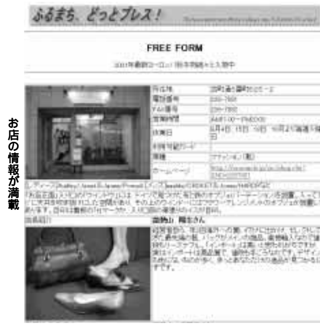
ふるまちどっとプレス! 古町6番町商店街2店舗をオープンし、インターネットから買い物ができる「ふるまちどっとプレス」を開業する。

市などで構成する市屋外広告物連絡協議会では、あす10日の屋外広告の日(クリーンキャンペーン)を実施します。同キャンペーンでは、屋外広告物条例について街頭での呼び掛けや、電柱などに設置された違法な張り札などのパトロールを行います。