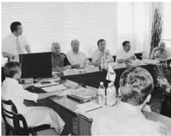
佐潟での取り組みなどについて報告する本市の代表団

本市とハルビン市、ハバロフスク市の3都市で、環境保護について話し合う会合がハバロフスク市で開催されました。3都市が一堂に集まり環境保護について話し合うのは、今回が初めて。環境保護を推進していくには国際的な協力が必要不可欠から、お互いの都市の実情や保全への取り組みなどを話し合い、交流を深めました。 7月23日から27日に開催された会議では、ハルビン市を流れる松花江とその下流にあたるハバロフスク市のアムール川の水質保全や、コウノトリ・ハクチョウなどの渡り鳥保護などをテーマに討議。本市からは、佐潟での渡り鳥保護の取り組みなどについて報告しました。 3都市の小学生が描いた環境絵画の展示会も、同時に開催されました。 ハルビン市と本市の環境分野での交流は、平成6年の友好都市提携15周年をきっかけに始まっています。大気汚染などに悩まされていたハルビン市を支援するため、情報交換をはじめ、技術研修生を受け入れたり、大気汚染自動測定機などを贈ってきました。 特に、友好都市提携20周年にあたる平成11年には、3局目となる大気汚染自動測定機とハルビン市内の7つの大気汚染自動測定局のデータを常時監視するテレメータシステムを贈呈し、ハルビン市内の大気汚染対策を支援しました。 今後も、3都市間の環境分野での交流を継続して行い、来年は本市で大気汚染防止をテーマとした会議を開催します。