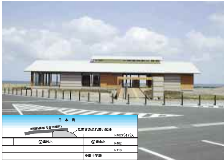
ゆうやけこぼり(写真)となぎさのふれあい広場の位置図(左下)

上新栄町地内の海岸で整備を進めてきた「なぎさのふれあい広場」が完成。広場の拠点施設となる、なぎさふれあいセンターの愛称が「ゆうやけこぼり」に決まり、駐車場と併せて7月20日に全面オープンします。これは、国道402号沿