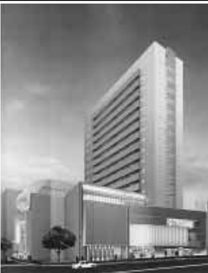
花園1丁目地区市街地再開発ビル完成予想図

園芸センター 申し込み 当日直接同センターへ 問い合わせ 同センターへ 5月1日は休み 春の長生蘭展 日時 きょう29日・あす30日午前9時～午後4時 エビネと山野草展 日時 5月3・4日午前9時～午後4時