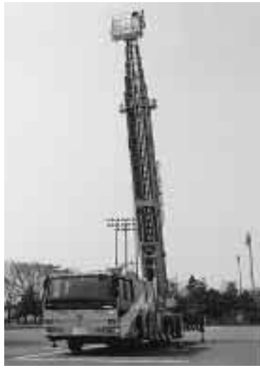
曾野木出張所に配備された40mはしご車

消防局では、曾野木地区および黒埼地区などでの、中高層建築物火災に対応するため、東消防署曾野木出張所に40mはしご付き消防ポンプ車を配備しました。40mを超えるはしご車の配備