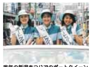
昨年の新潟まつりでのポートクイン

西総合スポーツセンター屋内プールが、3月24日にオープンしました。31日まで行われた、市民無料開放には、計4700人が来場。子どもから大人までたくさんの方が楽しめました。