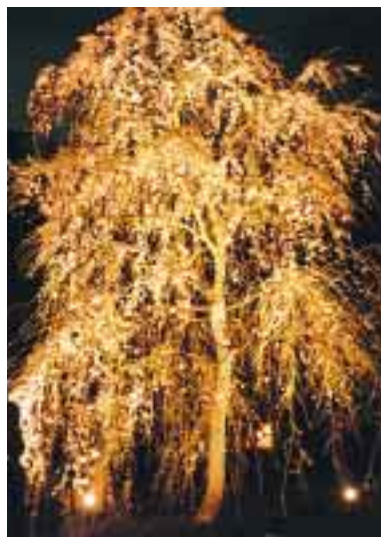
じゅんさい池公園のしだれ桜

いよいよ桜の季節がや ってきました。市内の各 所で、公園のしだれ桜 や、信濃川のしだれ桜 が、京都・円山公園 のしだれ桜から分けた 「祇園しだれ」という銘 木です。また、東池周 辺のソメイヨシノも見 ごろです。 併せてご観覧ください。 期間 4月14日~18日(雨 天中止) 点灯時間 午後6時~9時 場所 じゅんさい池公園 (松園2)東池近く(駐 車場側入り口) 期間中 は鳥屋野湯周辺では、4 月10日から30日まで、 「とやの湖桜まつり」と して、約200本のぼん ぼりを信濃川左岸のや すらぎ堤(JR越後線鉄 橋東北電力新潟電気 会館前)に設置しま す。 問い合わせ 観光物産課 (内線2513)へ とやの湖桜まつり 鳥屋野湯周辺では、4 月10日から30日まで、 一部交通規制を行いま す。誘導員や案内看板 などに従って駐車し てください。東土木事 務所(271-1361)へ 春咲きフェスタ 市や観光コンベンシ ョン協会などでは、「に いがた春咲きフェスタ 2001」として、鳥屋 野湯1周約8kmを歩 く「鳥屋野湯一周わ くわくウォーク」を はじめ、ヒップホッ プダンス大会やカヌ ー試乗会、キックタ ーゲット、ストラック アウトなど、楽しい 催し物がいっぱい です。 問い合わせ 駅南まつり 協会(245-3020)へ