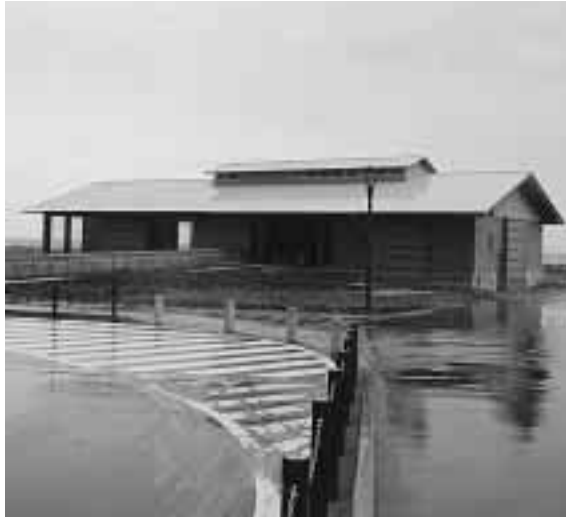
7月20日にオープンする「なぎさふれあいセンター」

問い合わせ 商工振興課(内線2522)へ 環境対策課(内線2724)へ 信保付とは信用保証協会の保証付きの略