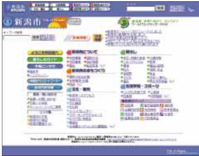
3月1日から新しくなった市ホームページ (アドレス http://www.city.niigata.niigata.jp )

市では、インターネットのホームページを、3月1日から全面的にリニューアルしました。 これまで、市のホームページからは、市政情報、暮らしのガイド、条例・規則などを見ることや、市立図書館の図書の検索・予約などができましたが、今回、掲載する内容を大幅に拡充するとともに、より使いやすくなるよう機能の追加を行いました。 また、「キーワード検索」「項目別索引」「組織別索引」を新たに設け、必要な情報を容易に探すことができるようになりました。 さらに、住民票の写しや戸籍謄抄本、所得証明書など、市民の皆さんの利用が多い申請書・届出書の様式については、ホームページから直接入手(ダウンロード)できるようにしました(ただし、申請書などの提出は、インターネットではできません。必要事項を記入の上、担当窓口へ提出してください)。 市では、これからも、市民の皆さんに役立つホームページの紹介をしていく予定です。ぜひご覧ください。 問い合わせ 電算情報課 (内線2132)へ