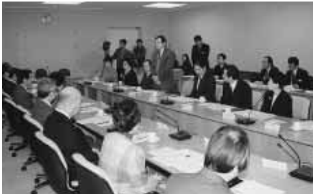
市児童虐待防止連絡協議会の初代会

市では、深刻化する児童虐待に対応するため、県中央児童相談所、市保育会、医療機関、弁護士会、警察など、18の関係機関で構成する「市児童虐待防止連絡協議会」を設置しました。これまで市では、児童虐待について具体的な対応策を検討するためのもの。第1回目の協議会では、同協議会の設置要綱についての協議、児童虐待の現状や情報提供などが行われました。今後は年2回開催する予定です。 市では、同協議会設置に先立ち、昨年12月までに旧新潟市域8地区に「地区児童虐待防止連絡会」を設置。地域保健福祉センター、保育園、幼稚園、小・中学校などの職員や関係者など約350人をメンバーとして、児童虐待の早期発見に努めるとともに、周囲の人たちへ児童虐待の通告義務の周知などの活動を始めています。(黒埼地区連絡会は今月中に設置する予定) 平成11年度に寄せられた児童虐待に関する相談件数は、全国で1万1631件で、10年度比約1.7倍に増加しています。県内においても10年度89件に対し、11年度には175件と約2倍の相談が寄せられました。年齢別では、小学生までが全体の80%以上を占めています。