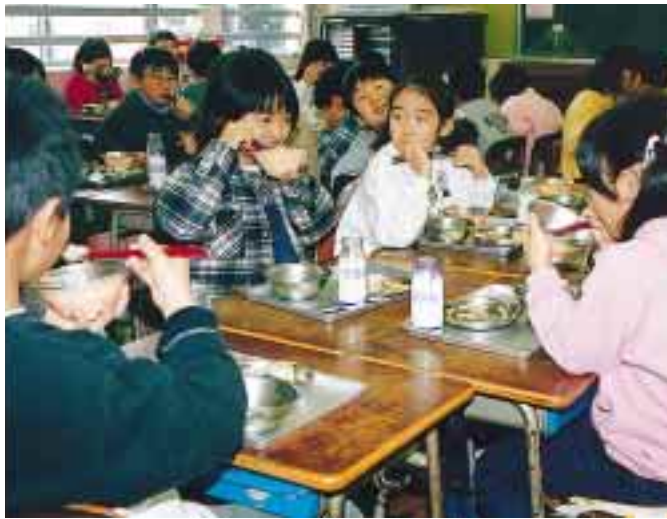
新しい食器で楽しく給食を食べる浜浦小学校の児童たち

市では、学校給食を実施している、市立の小学校58校、中学校4校、養護学校で、ご飯用食器の入れ替えを先月から順次進めています。これまで使用していたポリカーボネート樹脂製の食器が、環境ホルモンの溶出があると指摘されたことを受け、新しくステンレス・ポリプロピレン樹脂複合食器に入れ替えるもので、3学期からはすべての給食実施校でこの食器が使用されます。 ポリカーボネート樹脂製 平成7年に各学校へ導入し、ご飯用食器は、子どもたちにも使用してまいりました。しかしその後、ポリカーボネート樹脂の原材料の一部であるビスフェノールAが環境ホルモンの溶出があると指摘され、市では、新しい食器の導入に向けて検討を重ねてまいりました。 それぞれ素材が異なる食器について情報を収集し、その中で、選定されたのがステンレス・ポリプロピレン樹脂複合食器です。