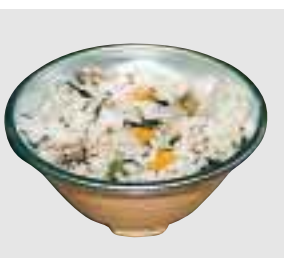
新しいご飯用食器

ステンレス・ポリプロピレン樹脂複合食器の特徴として、食品が接触する内面にステンレス、手に触れる外面にポリプロピレン樹脂を使用していることから環境ホルモンの溶出の心配がないこと、また、これまで使用していたポリカーボネート樹脂製食器と形状が類似しており、食器がこ、洗浄機、食器消毒保管庫などの備品、設備の変更が必要ないことなどが挙げられます。 今年6月から、豊照小、大夫浜小、鳥屋野小、白新の4校でこの食器を試験的に使ってもらい、安全性のほかに「子どもたちの反応」「食器が重くなることによる給食調理員の負担」など、食器の破損状況などを視点に調査を実施しました。 その結果、特に問題がないとの回答を各学校から得ることができたため、全校に導入することを決定しました。 食器の入れ替えは、先月から始まっており、3学期からはすべての学校で新しい食器を使用することになります。 問い合わせ 保健給食課 (内線3284)へ