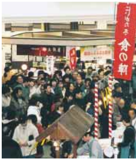
毎年多くの人でにぎわう食の陣・当日座

いよいよ本格的な鍋物の季節がやってまいりました。寒い外から帰ってきたときなどに、温かい鍋料理を頂くおしきは、寒い地方に住む人々の特権とも言える幸せ感でありましょう。 先日新聞に、同じ種類の野菜でも旬の時期に採れる野菜と旬以外の野菜では、ビタミンCやカロチンなどの栄養分の含有量に大きな差があることが出ていました。 前々から、同じホウレンソウやトマトでも、旬のものとはそれ以外では見た目は同じでも、どうも味が違う