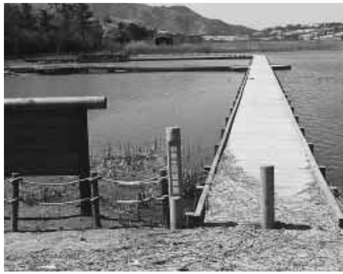
佐潟の自然生態観察園

市では、ラムサール条約登録湿地・佐潟の保全と賢明な利用を図るための「佐潟周辺自然環境保全計画」を策定しました。 佐潟は、流れ込む河川がなく、周辺砂丘地からの湧水や雨水などによって潤われており、日本の湖沼の中