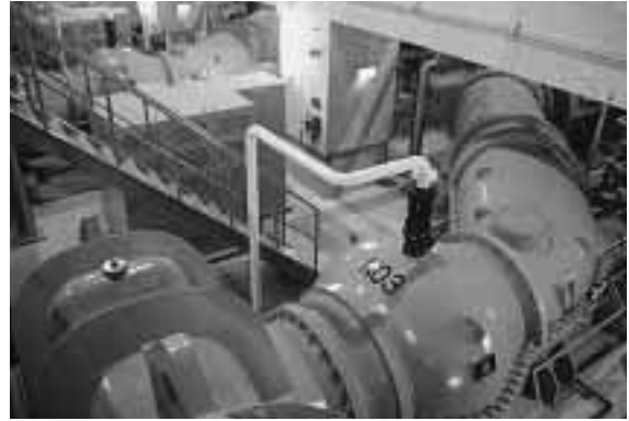
3台目のポンプが設置された白山公園ポンプ場

市では、平成10年の8・4水害を教訓として、計画を前倒しして、白山公園ポンプ場に3台目のポンプを設置しました。 同ポンプ場は、白山浦から信濃川下流側の新潟島の浸水被害の解消を目的に、平成6年度から建設を進めてきたものです。直径1.65メートルのポンプ2台を設置し、平成10年5月から稼働。 当初の排水能力は、1時間当たり約4万8千立方メートルで、昭和59年の豪雨時より降水量が多かったにもかかわらず、床上浸水被害が大幅に減るなどの効果がありました。 3台目のポンプが設置されたことにより、排水能力は1時間当たり約7万2千立方メートルにアップ。従来の1.5倍となり、より一層の雨水排水の効果が期待できます。 市では現在、最優先課題として雨水排水事業に取り組んでいます。本年度は、関係ポンプ場と小新ポンプ場の工事着手するほか、新下山ポンプ場の用地取得を予定しています。