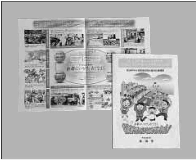
中心市街地活性化基本計画の概要を紹介したパンフレット

市では、空洞化しつつある中心市街地を再活性化し、個性あふれる「まちの顔」を取り戻そうと「中心市街地活性化基本計画」を策定しました。同計画は、おおむね5年から10年程度の期間を想定し、市街地の整備改善と商業などの活性化を一体的に推進するもの。中心市街地の将来像や、将来像の実現に向けた基本方針などを定めています。 同計画では、古町周辺地区、万代・沼垂周辺地区、新潟駅周辺地区の商業地域を中心とした約510万平方メートルの区域を「中心市街地の区域」と位置づけました。