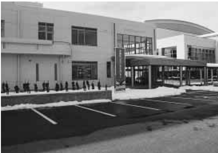
1月16日にオープンする北地区コミュニティセンター、右は北地区スポーツセンター

北地区スポーツセンター(名目所3)の敷地内に昨年1月から建設を進めてきた、北地区コミュニティセンターがこのほど完成し、1月16日にオープンします。同センターの完成により、地域住民の活動拠点施設として整備を進めてきたコミュニティセンターの市内全地区(8地区)への配置が完了しました。 市では、市民の自主的な交流の場を拡充することにより、それぞれの地域の特性を大切にしながら、コミュニティづくりを進めようと、昭和58年からコミュニティセンターの整備に取り組んできました。