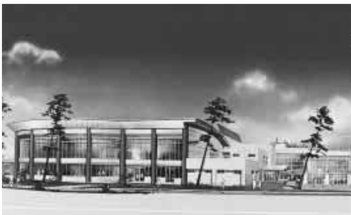
西総合スポーツセンター屋内プール完成予想図

西、坂井輪地区のスポーツ施設の拠点として、多くの市民に利用されている西総合スポーツセンター(五十嵐一の町)。7月からは、平成13年のオープンを目指して屋内プールの建設が始まりました。本格的なコースに加えウォーター 슬라이ダーなどもあり、子どもから大人まで、誰でも楽しめるプールになります。 一年中、水に親しめる屋内プールは、既にオープンしている西海岸公園市営プール、鳥屋野総合体育館屋上プールの屋内プール建設に内プールに続き、市の施設 対する要望は強く、従来あ